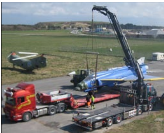
Jaktviggen" dvs. JA 37 lyfts ombord på trailern för transport 3-4 maj.