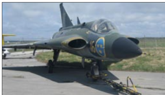
J 35F Draken

TEXT NILS-ÅKE STENSTRÖM