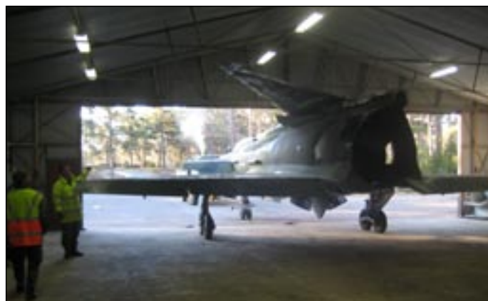
SF 37 Viggen (SF=SpaningFoto).