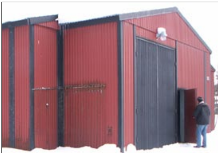
Fälthuset. Det byggdes som kylrum för konserver och är isolerat och i ypperligt skick. Golvytan är på 400 kvadratmeter.

När Gotlands Försvarsmuseum förvärvade Förrådsgården hösten 2010 så kom det att ingå en pärla – det f.d. kylförrådet med 400 kvm golvyta. Förrådet byggdes 1974-75. Det är i mycket gott skick, väl isolerat, och beklätt med plåt, såväl in- som utvändigt. Förvärvet innebär att många fordon, pjäser m.m. nu kan härbärgas inomhus. Fortifikatoriskt benämndes byggnaden tidigare för "Byggnad K0313.150". "313" är en kod för Tingstädeområdet, siffran 150 innebär att det är den etthundrafemtionde byggnaden som uppfördes inom detta område.