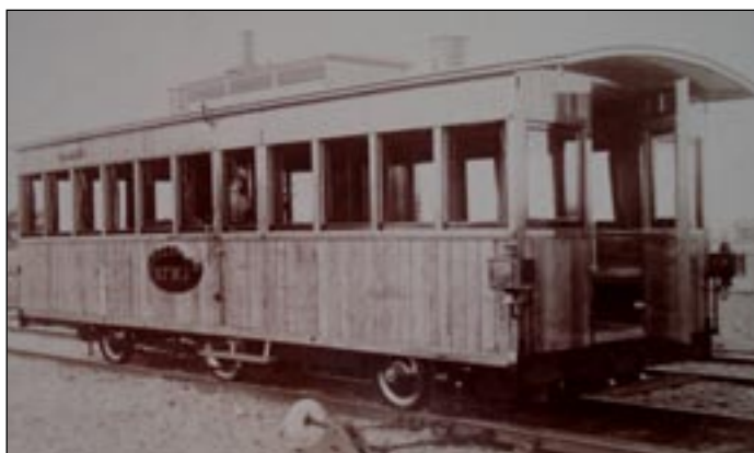
Så här såg den ut, den ångvagn som användes för personbefordran mellan Visby och Visborgsslätt. Vagnen inköptes begagnad från en järnväg på fastlandet men byggdes om något inför trafiken på VVJ. Bland annat byggdes en plattform i varje vagnsände.