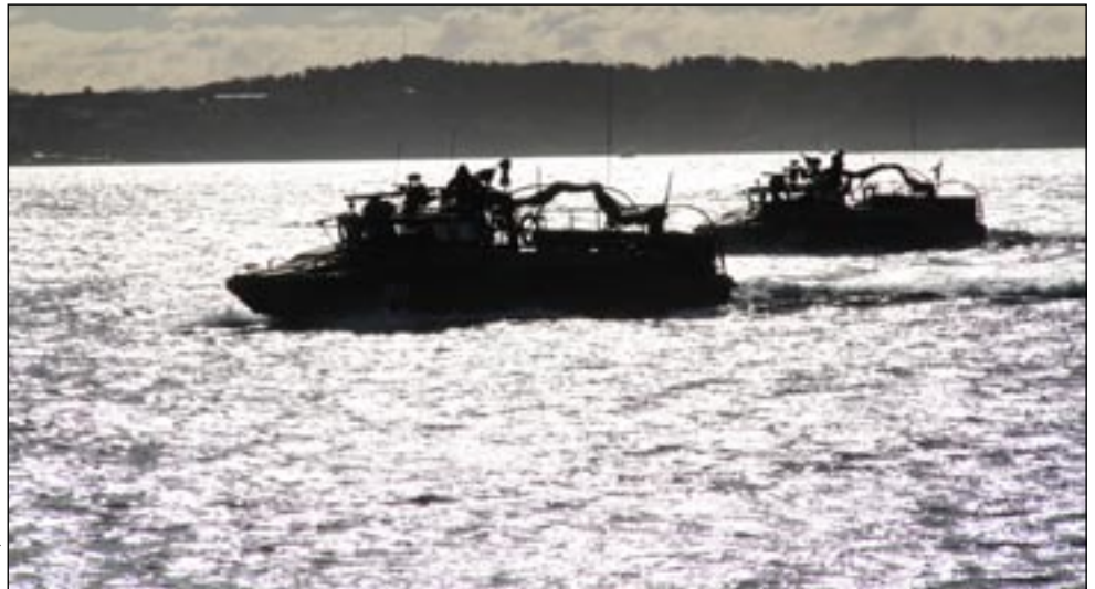
Delar av amfibiebataljonen under omgruppering till Lysekil

Det har övats flitigt på förbandet under året, både enskilda kompaniövningar, krigsförbandsövningar med hemvärn men också större Maringemensamma övningar.