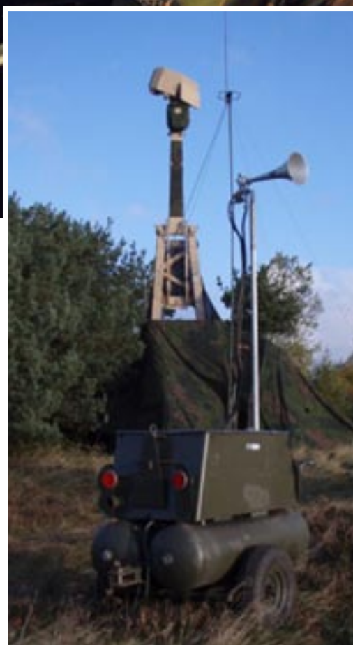
UndE 23 med larmaggregat för att kunna varna för RAM-mål

Inom området verkan kommer EldE 97 att anpassas för de nya formaten. När det gäller korträckviddigt luftvärn kommer det att tillföras mörkerförmåga och förmåga att bekämpa små mål typ kryssningsrobotar. Mörkerförmåga finns i idag på ett fåtal enheter men i framtiden kommer alla luftvärnseldenheter att ha den förmågan liksom möjligheten att bekämpa små mål. Alla detaljer inom IFLv är inte klara så det kan bli vissa justeringar. Planen är att allt skall vara beställt under första halvåret 2012.