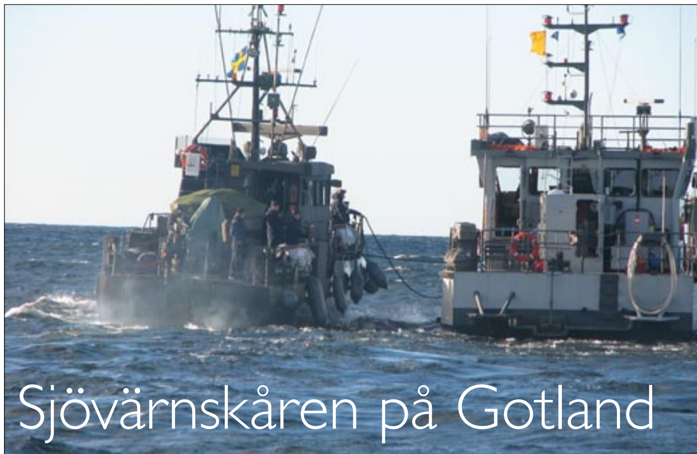
Övning 2010 tillsammans med Försvarets bevakningsbåt Järv

Sjövärnsskåren är en ideell organisation, som finns spridd över hela landet. Föreningen lyder under Försvarmakten. Det är bara vissa kårer, däribland Gotlands Sjövärnskår, som har tillgång till båtar och det av god standard. Båtarna ligger i Marinhamnen i Fårösund. En heter Hojskär och transporterar passagerare och en heter Fårö och är en ren transportbåt.