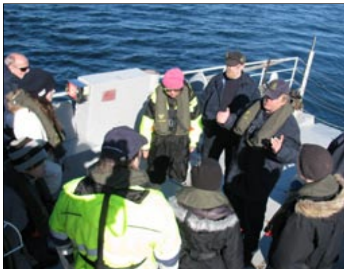
Säkerhetsutbildning Fårösund 2011