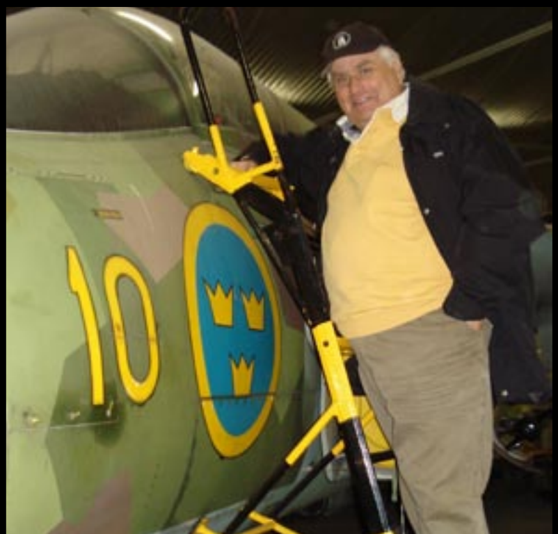
Flyg har åter landat i Tingstäde sid 14