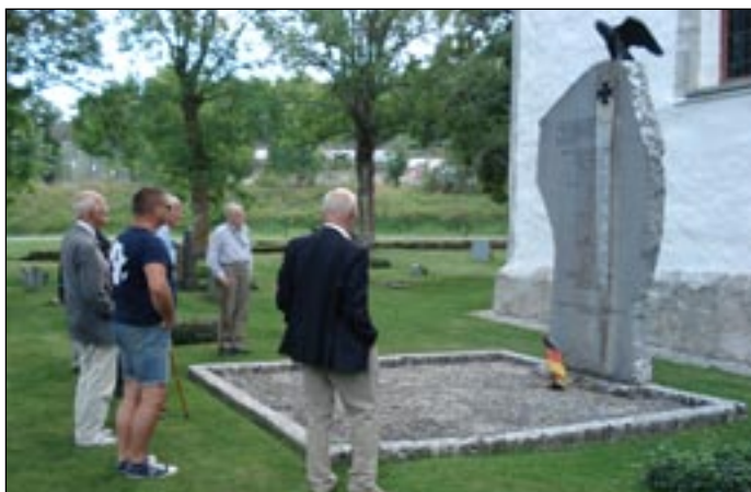
Ett av delmålen var Östergarns kyrka med gravstenen över de stupade på Albatross 2 juli 1915.