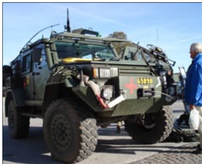
Intresset var stort för det ovanliga fordonet. Vapnet på motorhuvu är tillfälligt placerat där ur åskådarsynpunkt.