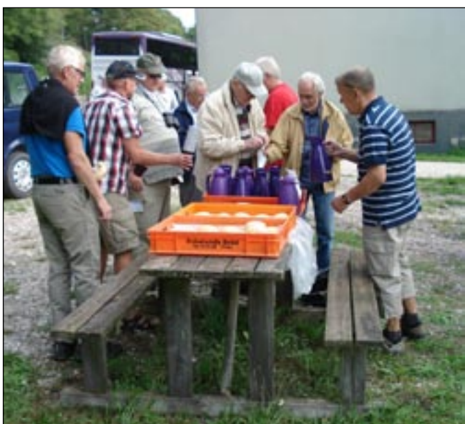
Det smakar gott med förmiddagsfika efter det första målet på Lindeberget.