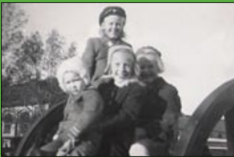
Växte upp på A 7