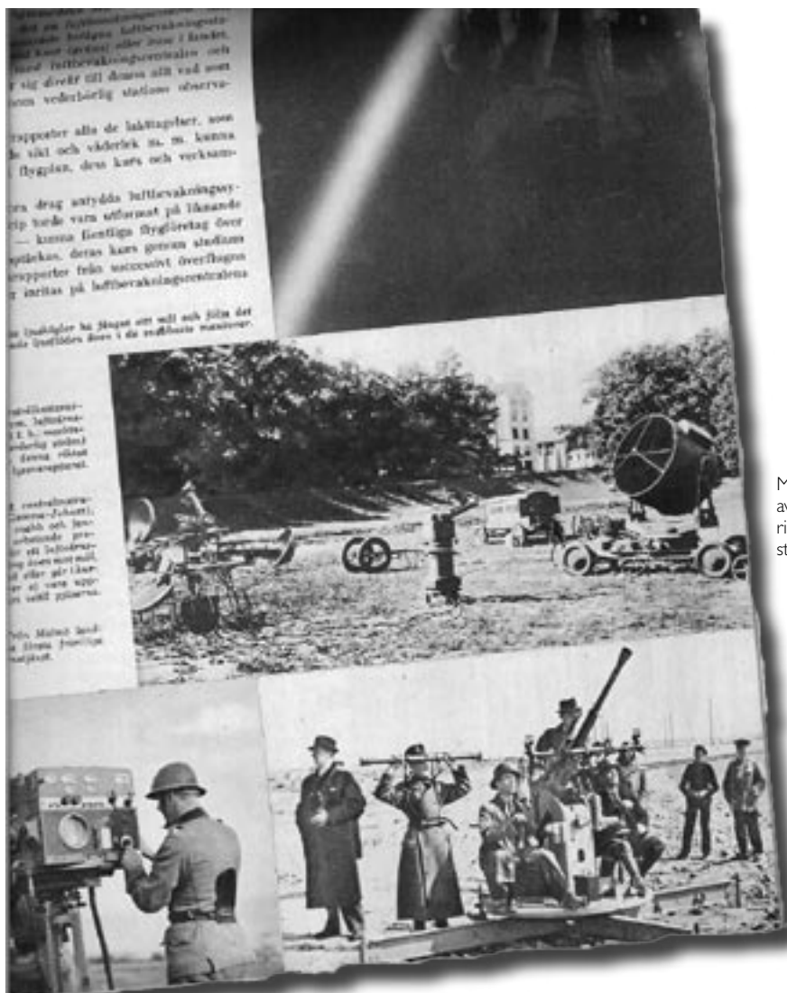
Materielen i en ledarstrålkastaravdelning. Fr v lyssnarapparat, riktapparat, maskinvagn och 150 cm strålkastare.