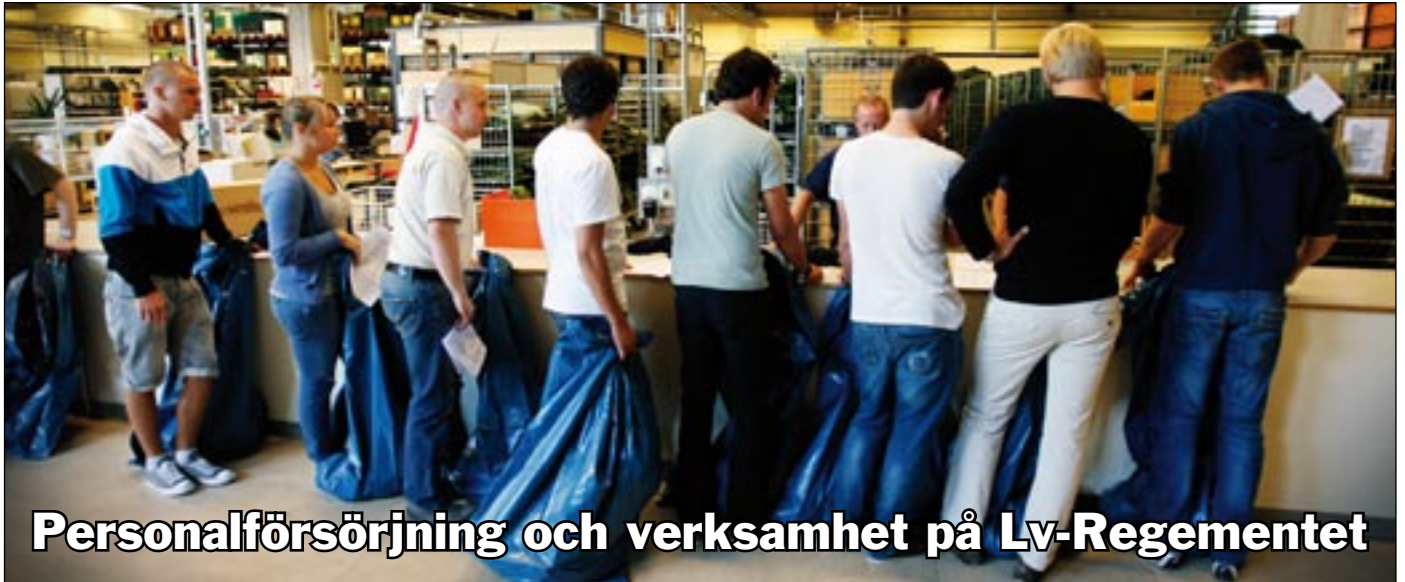
I tur och ordning fylls säckarna med utrustning till de 45 nya rekryterna.