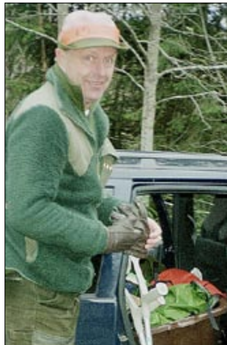
I jaktlaget 2006 i trakterna av Örnsköldsvik och Härnösand

Efter diverse turer hamnade jag som departementsråd och chef för organisationsenheten som ansvarade för beredskap m m för både krigs- och grundorganisationen och en del andra uppgifter, bl.a. Forsvarets Radioanstalt. Ett intressant jobb, men många kvällar och