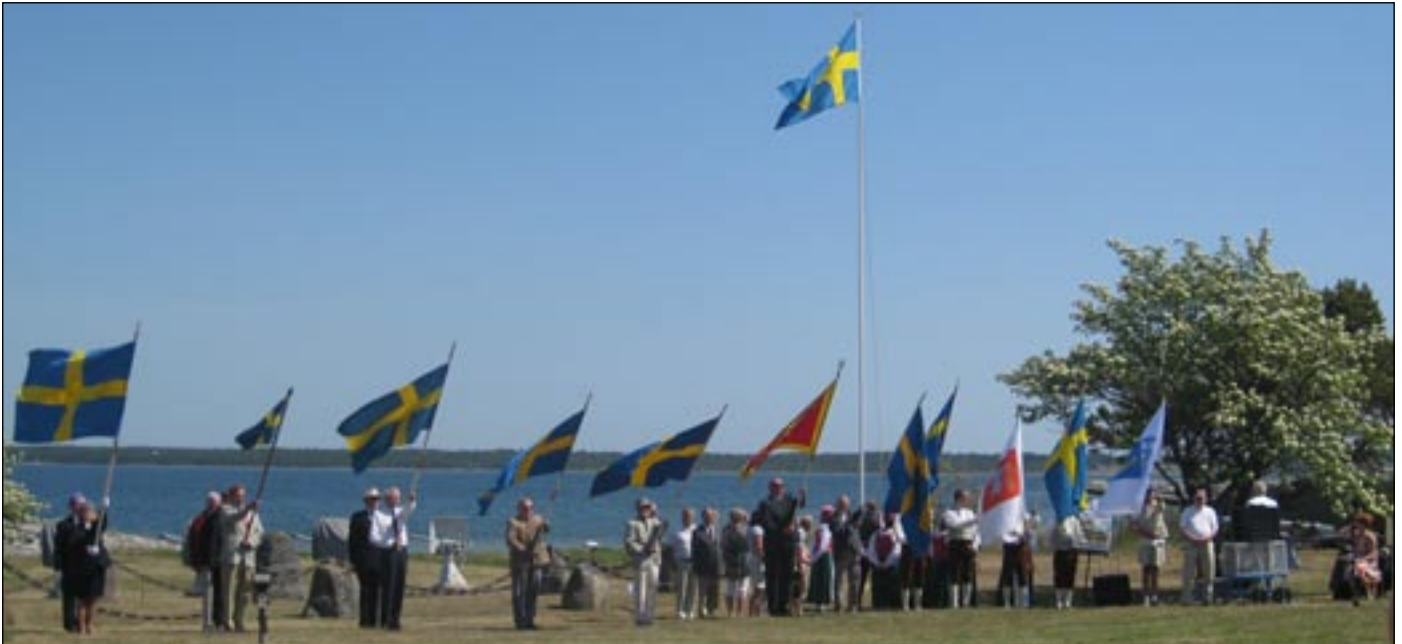
I fanborgen deltog i år Marinen med personal från bevakningsbåten "Djävur", Hemvärnet, Lottorna, Försvarets radio organisation, öns samtliga militära kamratföreningar, Röda korset och folkdanslaget. Kamratföreningarna börjar med tredje fanan från vänster; Lv 2 kf, A 7 kf, P 18 kf och KA 3 kf.