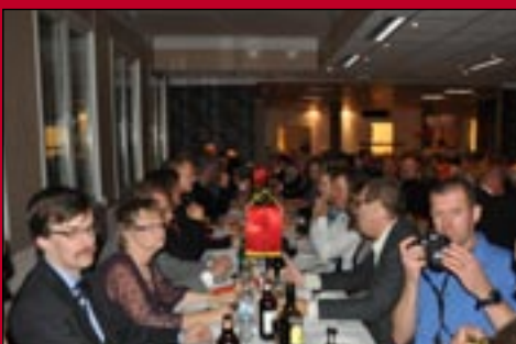
Återträff -äntligen efter 10 år