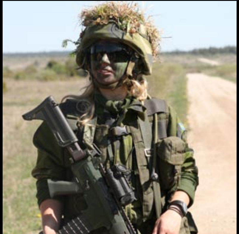
Tofta skjutfält används lika mycket idag sid 6