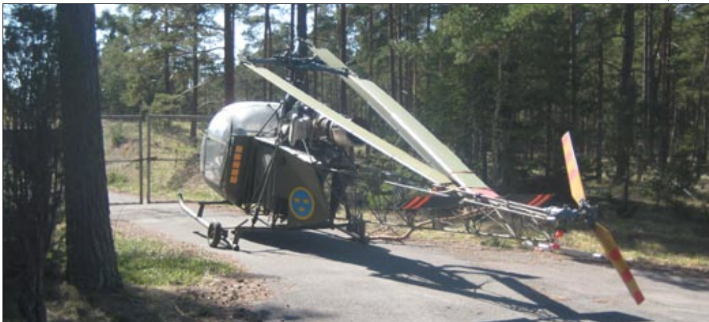
Helikoptern typ Hkp 2 vid Skans IV:s grindar

flygfält behövde förstärkas. F 17 G personal genomförde kompletterande rekognosering, främst beträffande vägbredden. Behovet var 11 meter, de svåraste passagerarna var Bro och Tingstäde samhällen, samt infarten till Lärbro. (asfaltvägbanan på väg 148 är åtta meter bred).