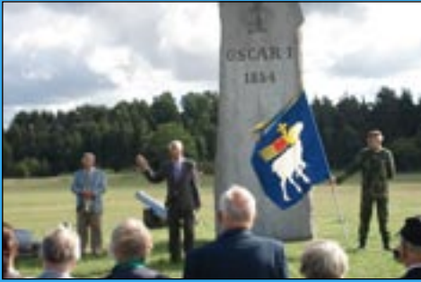
Jubileum vid Oscarsstenen